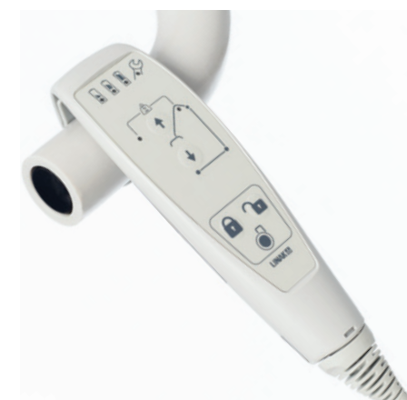
Système de freinage électrique central pour bloquer rapidement les roues avec la télécommande

Les chaises de bain de ConfortMedic sont équipées de manière standard d'un arrêt d'urgence, d'une descente manuelle, d'une télécommande multifonctions avec affichage du niveau de batterie, de deux batteries amovibles, d'une station de recharge murale et d'une sangle de sécurité. Vous pouvez aussi ajouter des options :