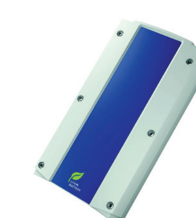
Batterie au Lithium