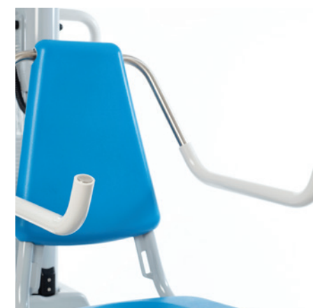
Choix d'appuis-bras courbés vers le haut (ouvert) pour besoins spécifiques