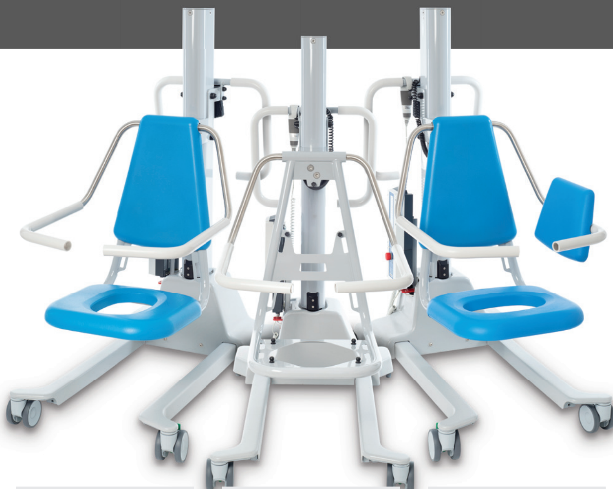
Ensemble de coussins pour chaise frontale

ConfortMedic a conçu une version polyvalente qui permet de modifier la chaise afin de l'adapter à un accès frontal ou latéral selon la configuration de la salle de bain et les besoins du résident. Un simple changement de coussins permet de convertir la chaise selon les besoins.