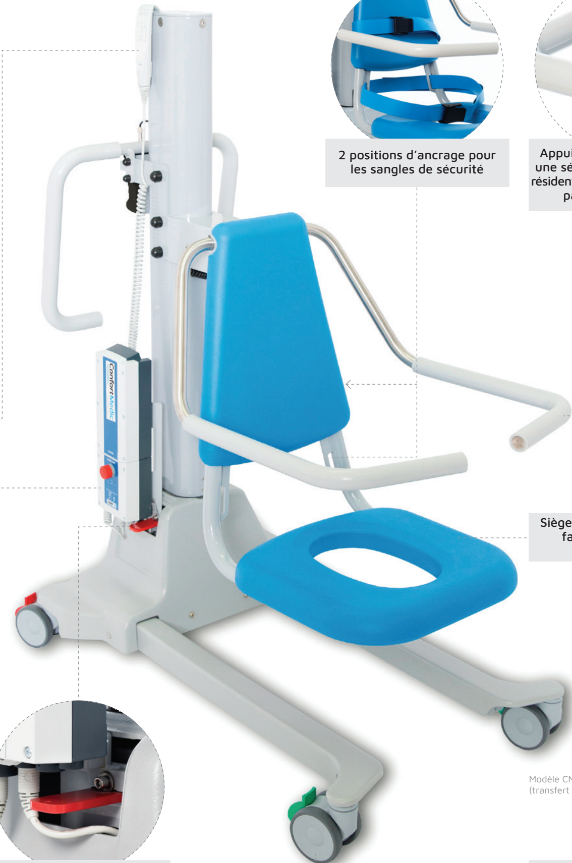
Modèle CM1000 (transfert frontal)

Roues doubles scellées : - arrières avec freins - avant directionnelles