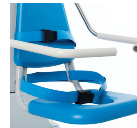
Sangles de sécurité additionnelles pour 2 positions