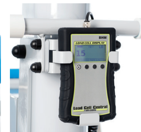
Pèse-personne digital intégré pour afficher le poids du résident