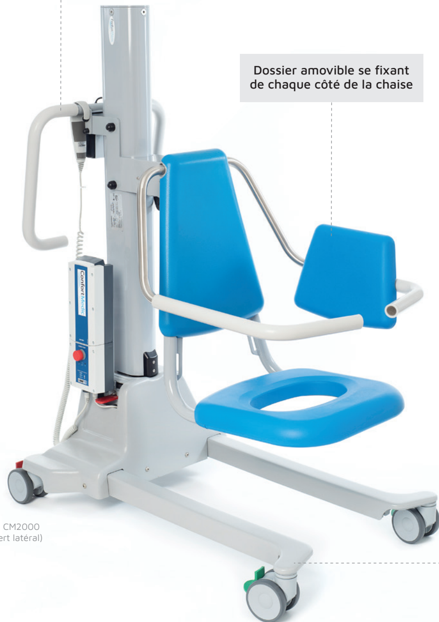
Modèle CM2000 (transfert latéral)

Configuration de la base permettant un transfert simple et sécuritaire pour le résident